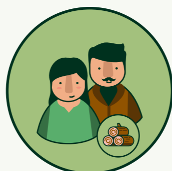
PYMES DEL SECTOR